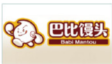
上海中餐饮饮管理有限公司 Shanghai China Food & Beverage Management Co., Ltd.