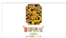
广州市海珠区御膳房烧卤坊 Guangzhou Zhuhai Yushanfang ShaoLufang