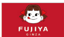
不二家(杭州)食品有限公司 Fujiya (Hangzhou) Food Co., Ltd.