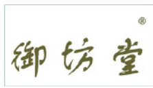
宁波御坊堂生物科技有限公司 Ningbo yufangtang Biological Technology Co., Ltd.