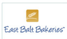
上海怡和斯宝特面包工业有限公司 Shanghai East Balt Bakeries Co., Ltd.