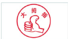
四川大拇指食品有限公司 Sichuan Damuzhi Food Co., Ltd.