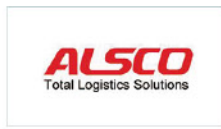
苏州工业园区安华物流系统有限公司 Alasco Logistics System Co., Ltd.