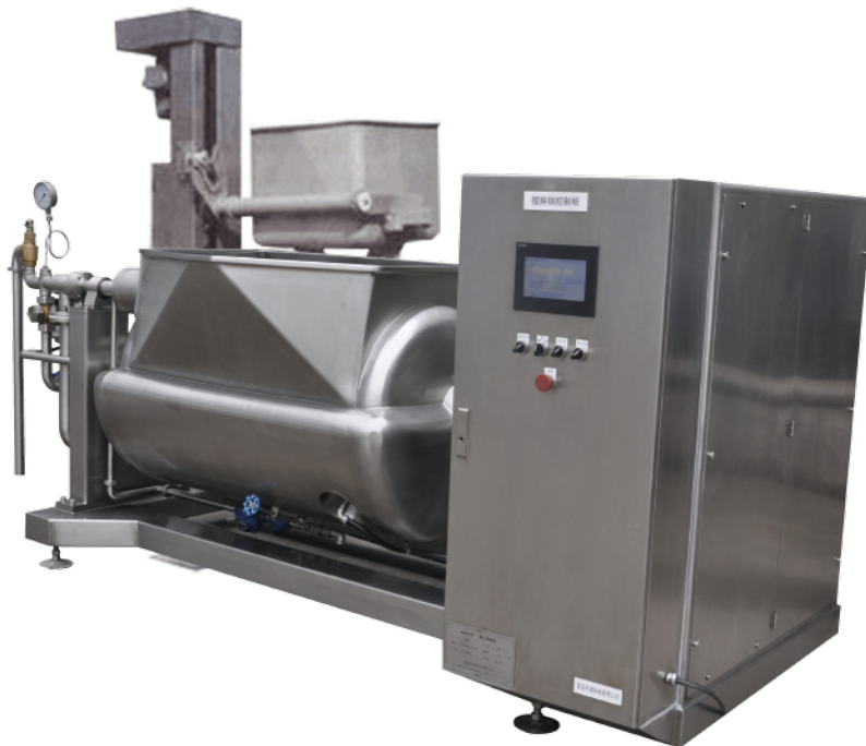
▶ 可用提升机直接倒料 Ascension to pour material