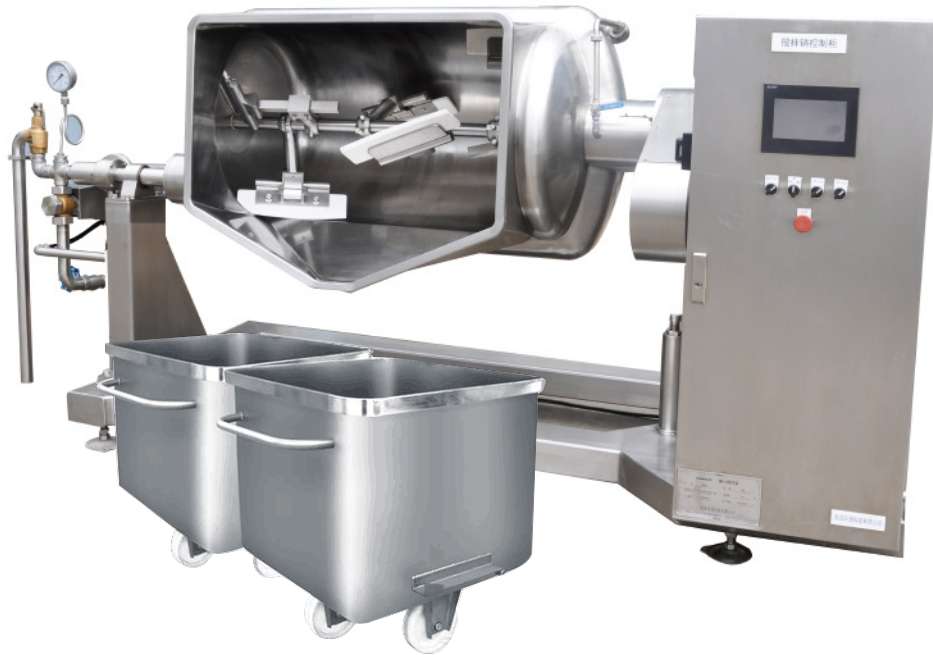
▶ 可直接对接物料车 Direct docking