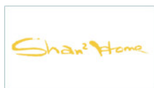
浙江山山家食品有限公司 Zhejiang Shanshanjia Food Co., Ltd.