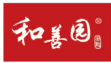
南京和善园餐饮管理有限公司 Nanjing Heshanyuan Catering Trade Management Co., Ltd.