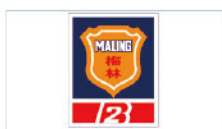
上海梅林正广和(绵阳)有限公司 Shanghai Meibayashi Masahiro (Mianyang) Co., Ltd.