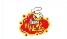
吉林市辣怪鸭食品有限公司 Jilin Laguaiya Food Co., Ltd.