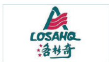
石家庄洛杉奇食品有限公司 Shijiazhuang Losang Food Co., Ltd.