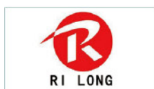
山东日龙食品有限公司 Shandong Dragon Food Co., Ltd.