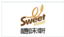
穗味轩食品有限公司 Sweet Mixed Food Co., Ltd.