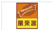
佛山市风来客宠物用品有限公司 Foshang Nawlers Co., Ltd.