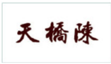
北京刘家窑天桥陈食品有限公司 Beijing Liujiayao Tianqiao Chen Co., Ltd.