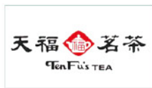
漳州天福茶业有限公司 Zhangzhou TenFu's Tea Co., Ltd.